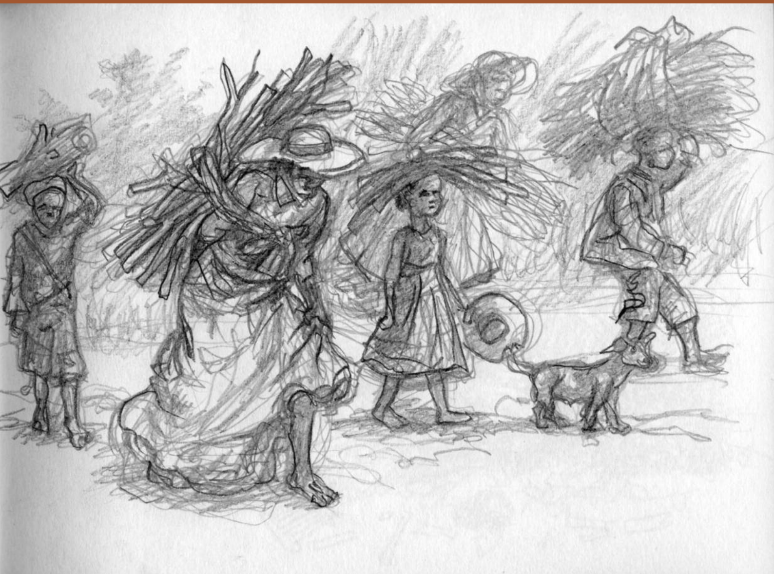
Croquis préparatoire, La Réunion 1916, Raymond Barthes © 2014